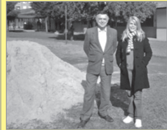
Doação de areia para cancha esportiva da Associação Paranaense para o Desenvolvimento do Potencial humano - APADEH