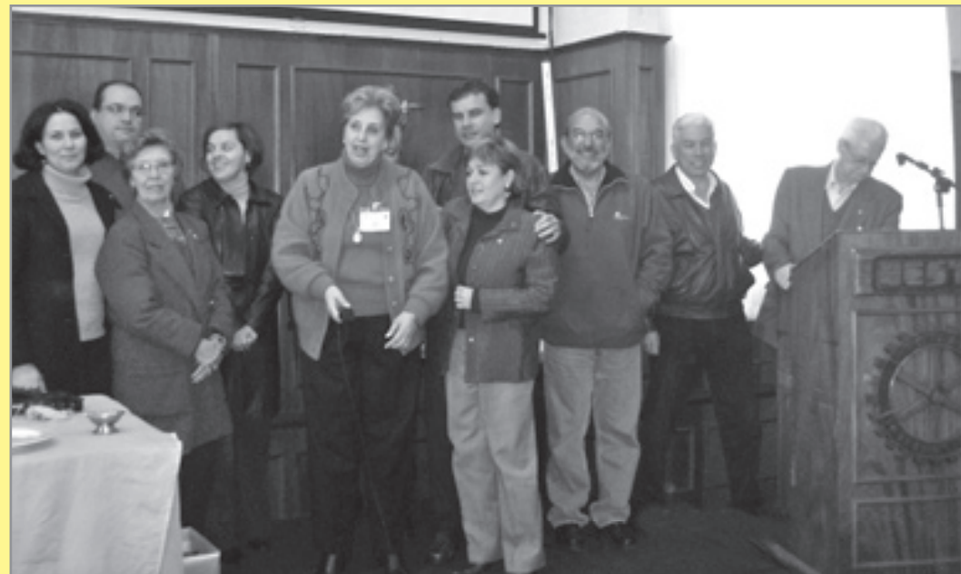
Apresentação do novo Conselho Diretor 2008/2009