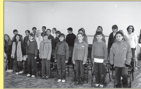
Homenagem do RCCO ao coral da Escola Vinhedos