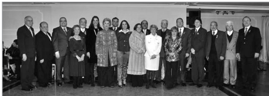
Apresentação do novo Conselho Diretor 2008/2009