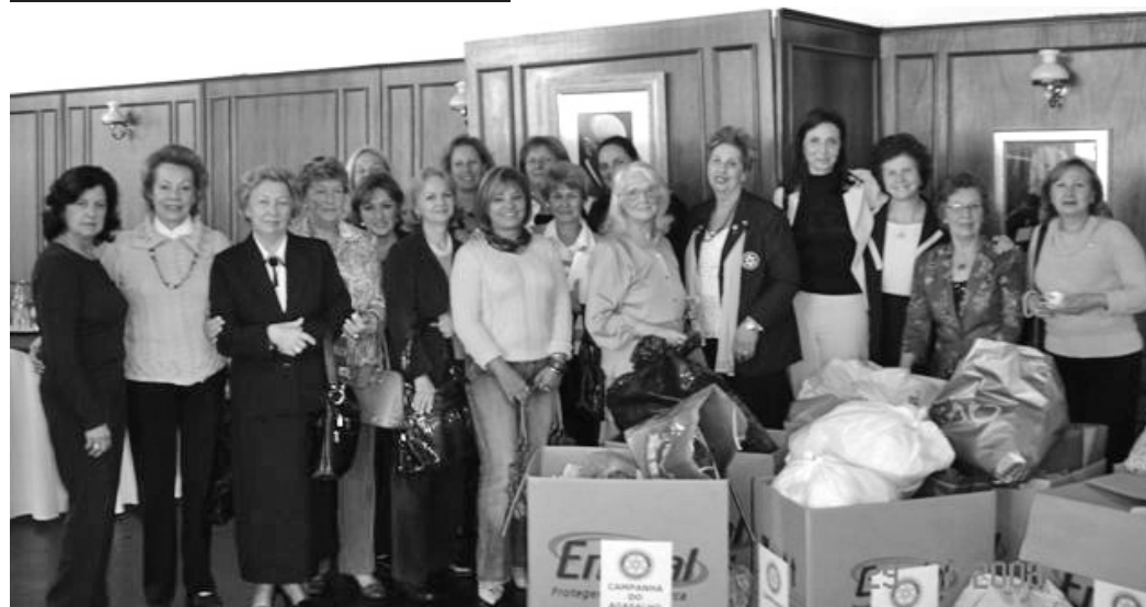
Campanha do Agasalho 2008

Notícias do Rotary International - 11 junho 2008