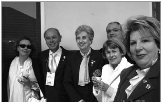
Companheiros do Oeste com o Representante do Presidente de RI