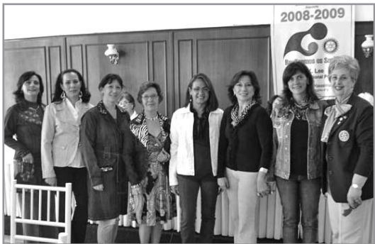
Companheiras que desfilaram com as Sras da Confecção