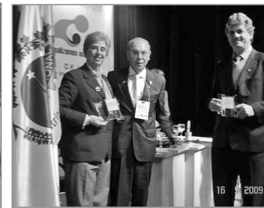
Representante do Pres. R.I.; Pres. RCOeste e o Pres. RCCuritiba