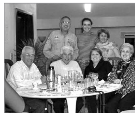
R.C.C.O. reuniões domiciliar