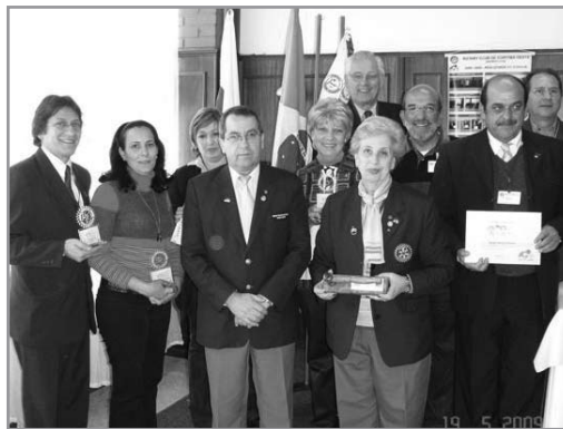
R.C.C.O. reunião entrega Premiação a equipe Distrital março, abril, maio