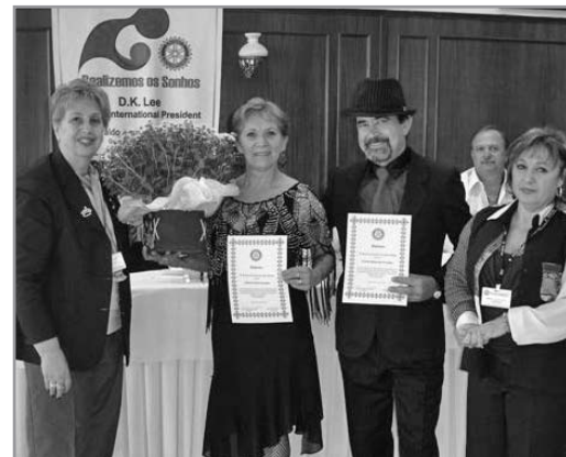
Reunião Festiva - casal dançou tango