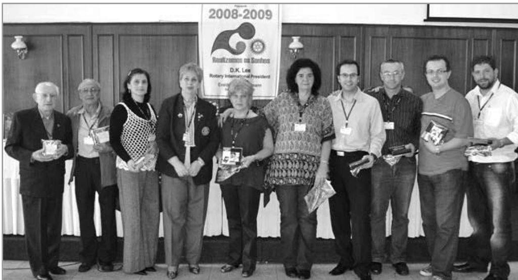
Homenagem aos Profissionais março, abril, maio