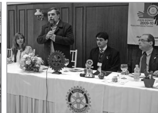
Palestra de Flávio Arns