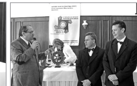
Homenagem ao Dia do Garçon