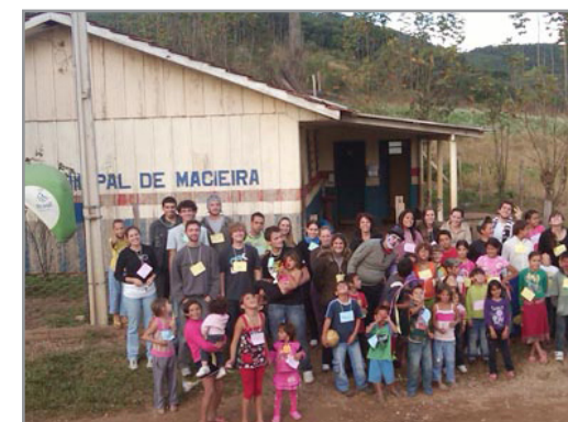
Parceria Rotaract e PUC-PR em prol da Comunidade da Macieira.

A ajuda específica que será oferecida à cada família será feita através da ONG Fenix, porém todos os alunos são convidados a continuarem participando das ações na comunidade.